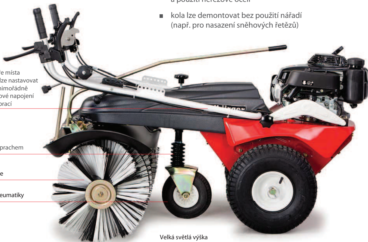
Velká světlá výška