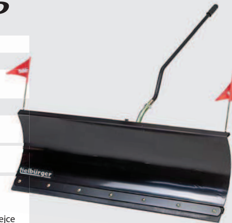
Na obrázku je vyobrazen model TS125